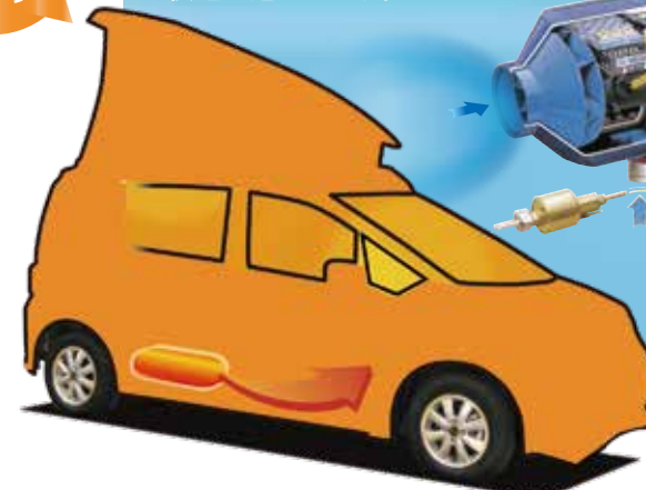
エアヒーター本体取付イメージ

冬はもちろん、夏でも山の朝晩の冷え込みなど、エアヒーターがあれば1年中車内は快適です。エアヒーターシステムで、車内のエンジンとは独立したヒーティングシステムによりエンジンを止めた状態で車内を長時間暖めることができます。FF式だから、微量のガソリンを燃やすための空気を車外から取り入れ、燃焼後のガスを車外に排出するクリーン暖房。車内の空気を汚すことなく、においも無く換気をする必要もありません。