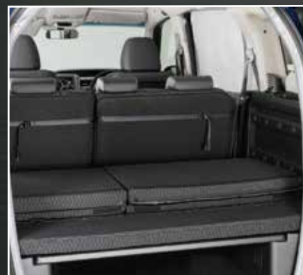
走行時フラットクッションマットは折りたたんで収納することができます。

コンパクトなボディに、夢と機能がギュッ！ ちょうど便利で、ちょうど楽しい、 ジャストフィットなコンパクトキャンパー。 身も心も軽やかに 次世代コンセプトカー「フリースタイル」。