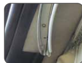
上部スライドレール

ハイエースの大きなスライドドアを快適に活かすことができる、フライスクリーン。専用設計で無駄がなく、スライド式の少ない力で開閉が可能な防虫システムです。