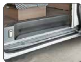
オリジナルステップ